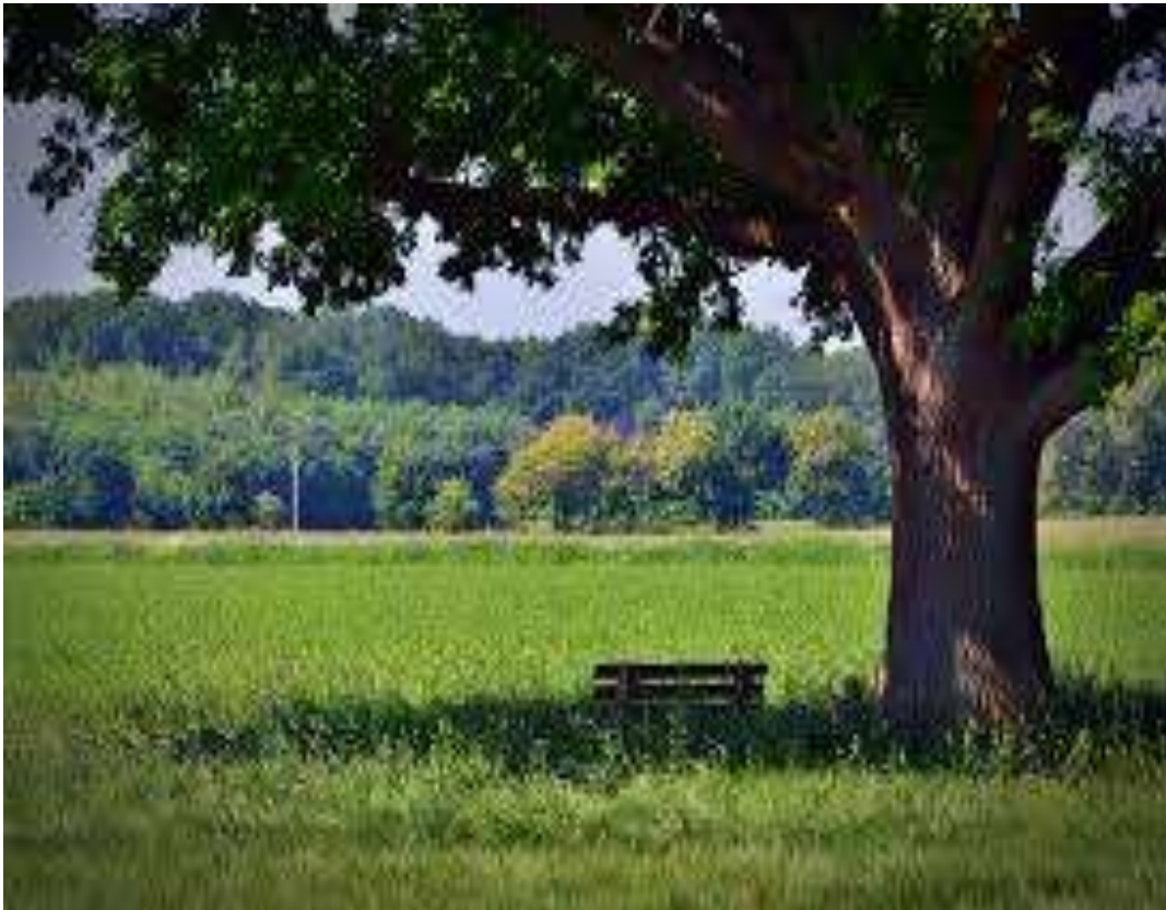
Рис. 11. Отдых под дубом