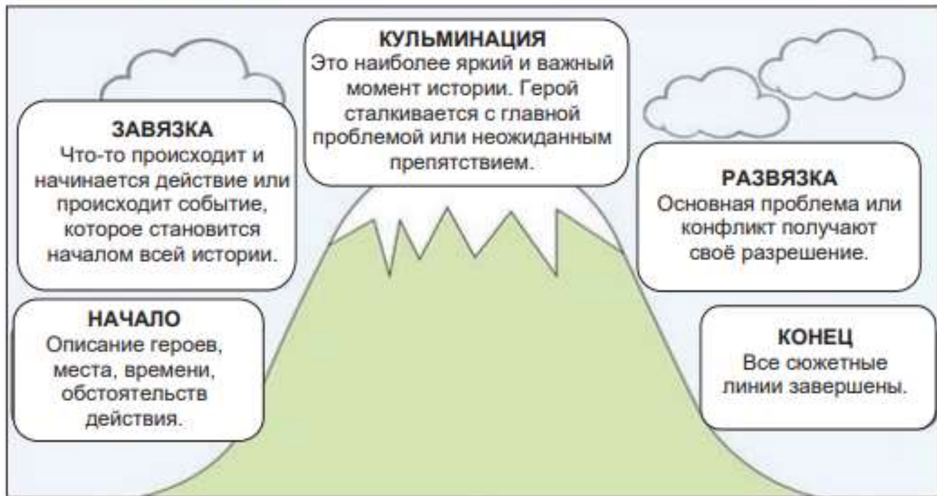
Схема 8. Карта истории