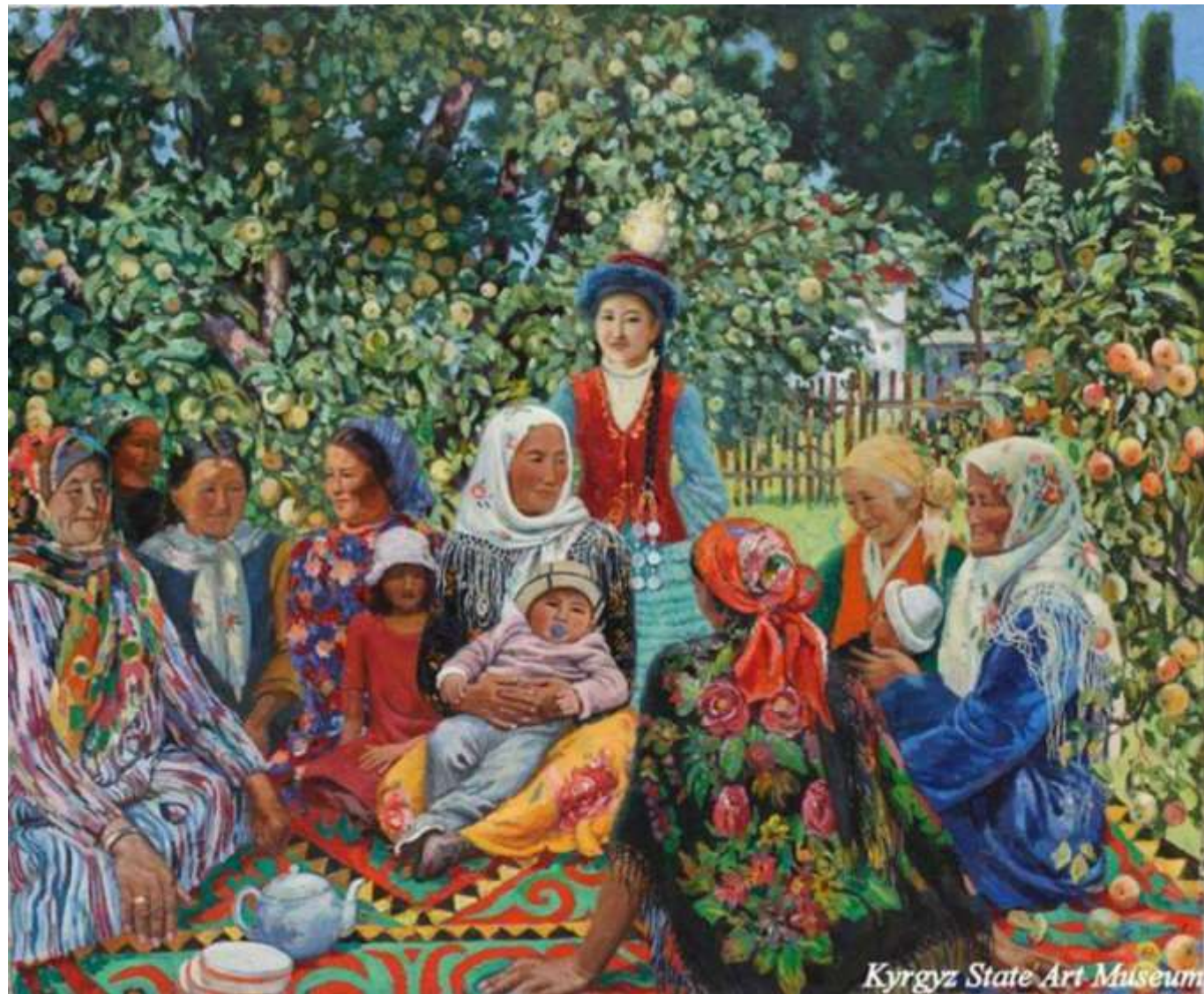
С. Чокморов «Майрам»